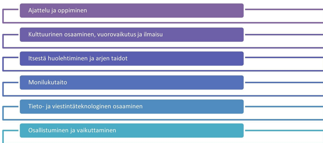
Kuva1: Laaja-alaisen osaamisen osa-alueet